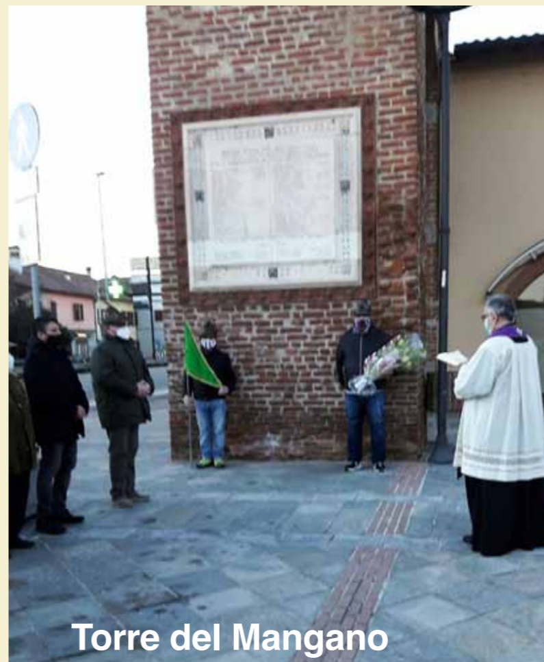
Torre del Mangano